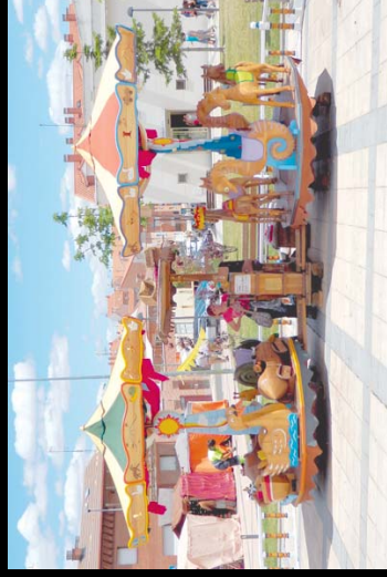
Carrusel tradicional ecológico